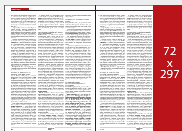
Seriál v redakčním textu