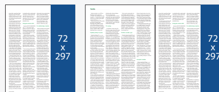
Seriál v redakčním textu