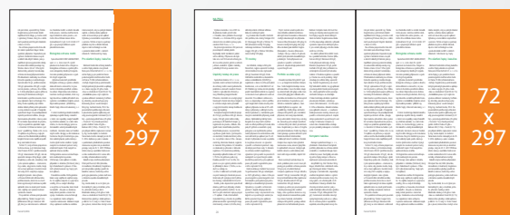
Seriál v redakčním textu