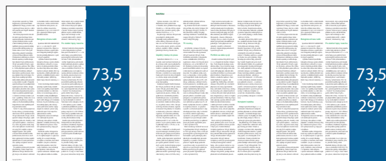
Seriál v redakčním textu