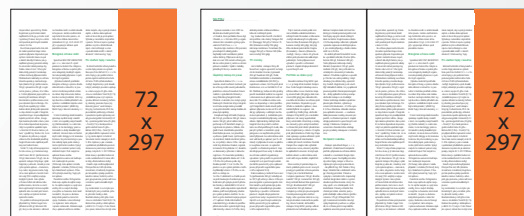
Seriál v redakčním textu