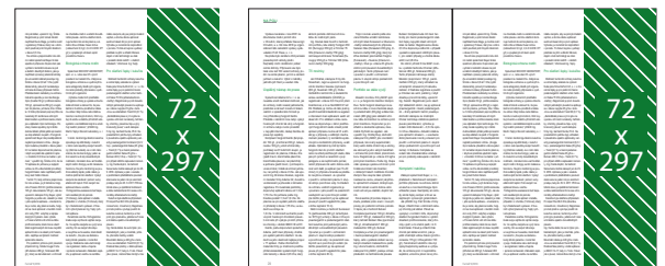
Seriál v redakčním textu