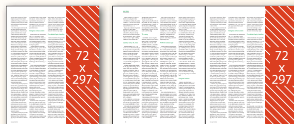
Seriál v redakčním textu