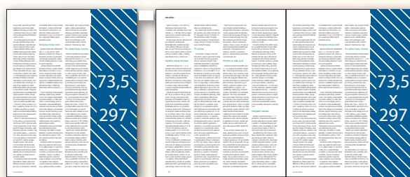
Seriál v redakčním textu