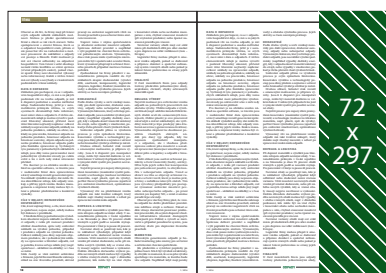
Seriál v redakčním textu