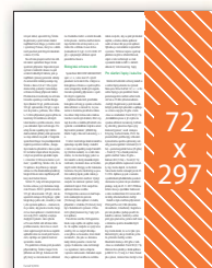
Seriál v redakčním textu